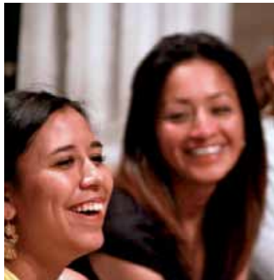
EN UNA SESIÓN DEL TALLER.

“El planteamiento de Territorios me gusta muchísimo porque tiene que ver con el goce de la vida en ge-