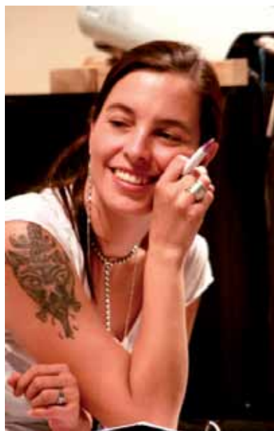
LORENA WOLFFER, ARTISTA.

Esta serie de performances, dijo Wolffer, “nos van a acercar a las vidas de estas mujeres y a deshacernos de todas las preconcepciones que tenemos sobre lo que significa ser una mujer policía o una mujer del barrio en el Centro”. ✨